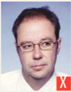
sguardo rivolto di lato