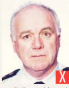
effetto occhi rossi