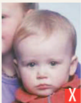
presenza di altra persona