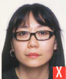
montatura troppo pesante