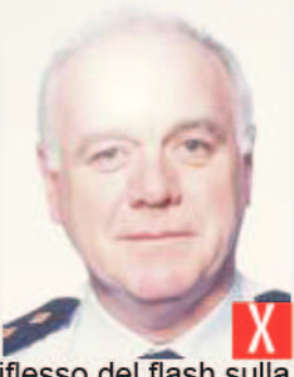
riflesso del flash sulla pelle