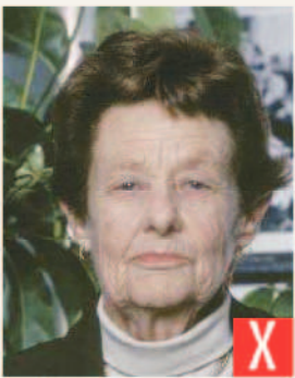
sfondo non a tinta unita