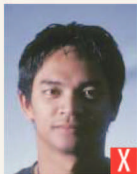
ombre sul viso