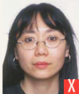
montatura che copre gli occhi