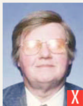
riflesso del flash sulle lenti