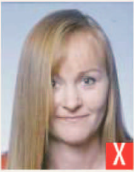
capelli sugli occhi