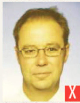
tonalità innaturale della pelle