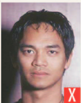
ombra dietro la testa